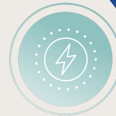
DIVERSIFY ENERGY SOURCES