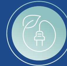
ACCELERATE CLEAN ENERGY TRANSITION